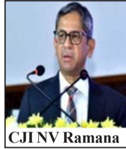
CJIN V Ramana

another bench, comprising justices Rohinton F Nariman and BR Gavai, warned that the nation is "losing its patience" in waiting for lawmakers to cleanse politics by